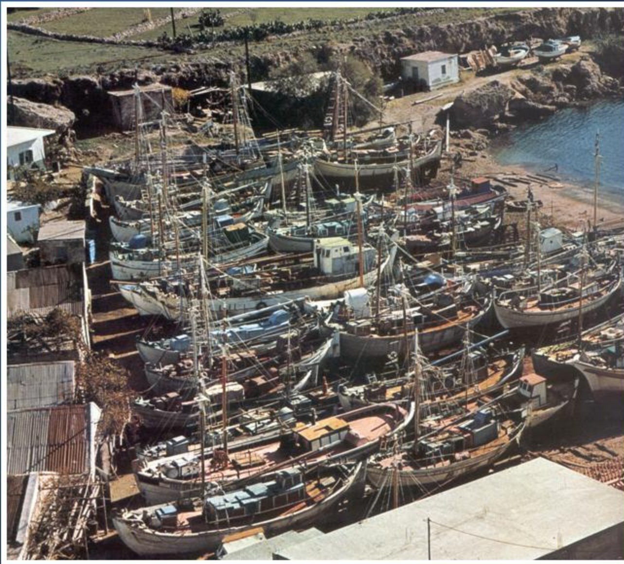
Κάλυμνος, Λαφάσι. Ο ταρσανός το 1970. Ναυτικό Μουσείο Καλύμνου